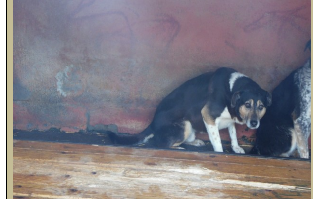
Razza : meticcio (N. B. F.) Sesso: maschio * Microchip n.° 380260010031183 Stato: Adottabile Ricoverato da giugno 2010