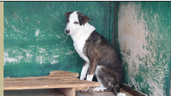
Razza: meticcio (Bianco/Tigrato) Sesso: maschio Microchip n.° 380260041235619 Stato: Adottabile Ricoverato da ottobre 2013 (nato feb./marzo 2013)