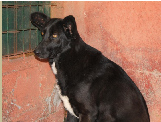
Razza: meticcio (N. / B.) Sesso: femmina * Microchip n.° 380260010026724 Stato: Adottabile Ricoverata da giugno 2010