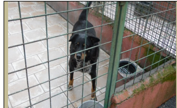
Razza: meticcio Sesso: maschio Microchip n.° 0977200004542625 Stato: Adottabile Ricoverato da dicembre 2006