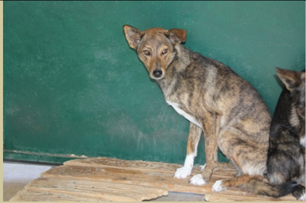
Razza : meticcio (Fulvo/Tigrato) Sesso: femmina Microchip n.° 380260041236121 Stato: Adottabile Ricoverata da ottobre 2013 (nata feb./marzo 2013)