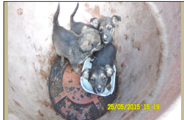
Razza: meticcio (cucciolo) Sesso: femmina Microchip n.° 380260042563170 Stato: adottabile (grigio chiaro /focato) Ricoverata dal 25 maggio 2015