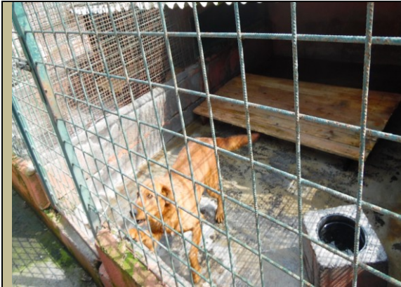
Razza : meticcio Sesso: maschio Microchip n.° 380260041038950 Stato: Adottabile Ricoverato da gennaio 2013