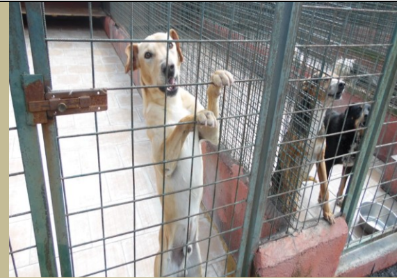
Razza: meticcio Pitbull (Fulvo) Sesso: maschio Microchip n.° 380260100009579 Stato: Adottabile Ricoverato da novembre 2013