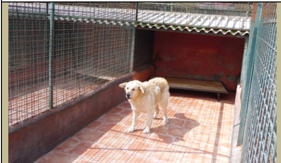
Razza: meticcio (bianco) Sesso: femmina * Microchip n.° 380260010026755 (sterilizzata) Stato: Adottabile Ricoverata da giugno 2010