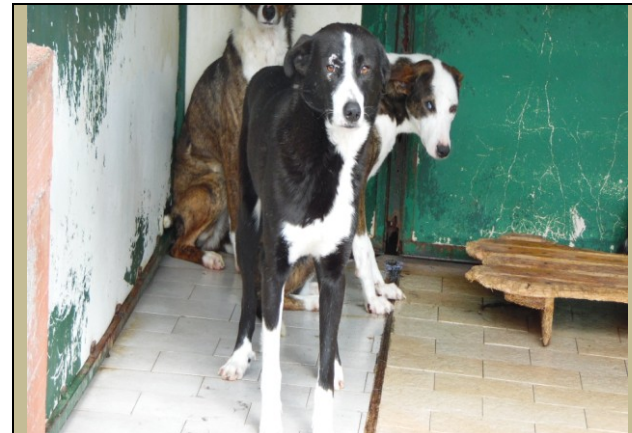
Razza: meticcio(Bianco/Nero) Sesso: maschio Microchip n.° 380260041236124 Stato: Adottabile Ricoverato da ottobre 2013 (nato feb./marzo 2013)