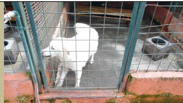
Razza: meticcio (Bianco) Sesso: femmina Microchip n.° 380260100035926 Stato: Adottabile Ricoverata da novembre 2014