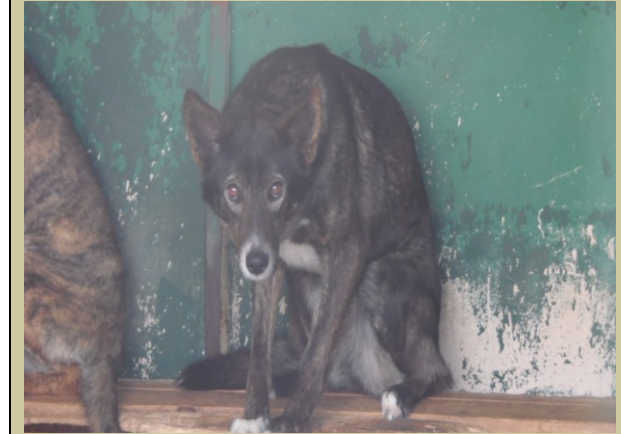
Razza: meticcio (Nero/Tigrato) Sesso: femmina Microchip n.° 380260041235428 Stato: Adottabile Ricoverata da ottobre 2013 (nata feb./marzo 2013)