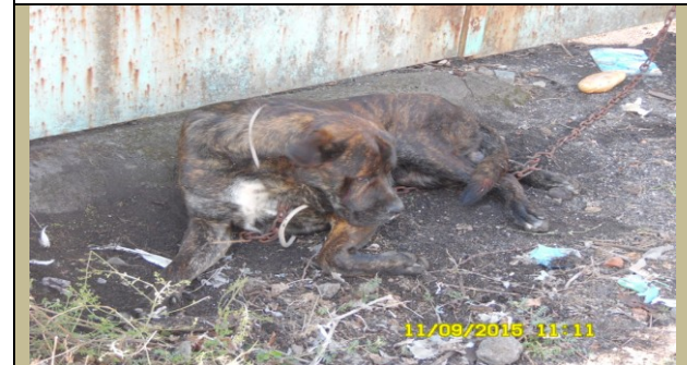
Razza: Corso Sesso: maschio Microchip n.° 380260042335094 Stato: (tigrato) Ricoverato dal 11 settembre 2015