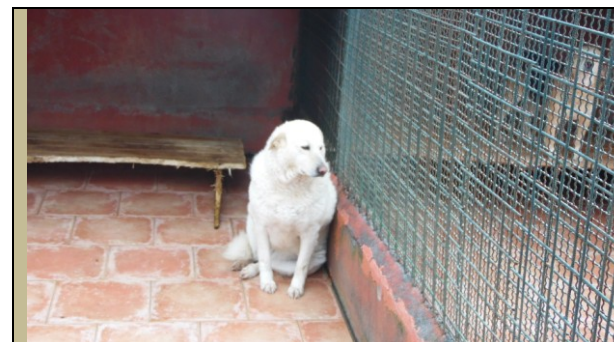
Razza : meticcio Sesso: femmina Microchip n.° 3802600110007710 ( Sterilizzata ) Stato: Adottabile Ricoverata da luglio 2009