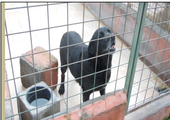
Razza: meticcio Sesso: maschio Microchip n.° 0977200001633733 Stato: Adottabile Ricoverato da gennaio 2006