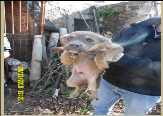
Razza : meticcio (cucciolo) Sesso: maschio Microchip n.° 380260042642033 Stato: adottabile (fulvo) Ricoverato dal 29 dicembre 2015