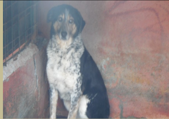
Razza: meticcio(B. N. F.) Sesso: femmina * Microchip n.° 380260010026607 Stato: Adottabile Ricoverata da giugno 2010