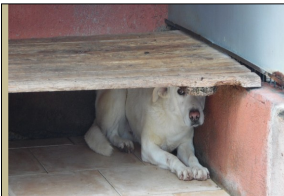
Razza: meticcio Sesso: maschio Microchip n.° 939000010028598 Stato: Adottabile Ricoverato da aprile 2008