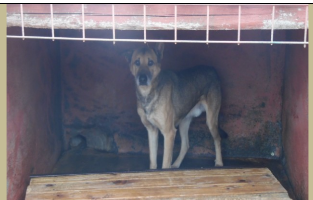
Razza : meticcio Sesso: maschio Microchip n.° 939000010028966 Stato: Non adottabile (aggressivo) Ricoverato da febbraio 2005