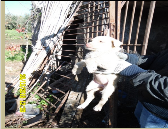
Razza: meticcio (cucciolo) Sesso: femmina Microchip n.° 380260042641237 Stato: adottabile(miele) Ricoverata dal 29 dicembre 2015