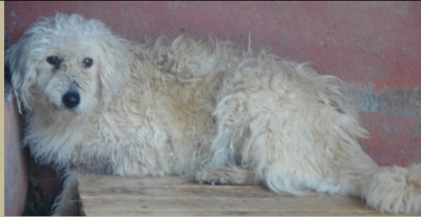
Razza: meticcio (bianco) Sesso: femmina * Microchip n.° 380260010113530 Stato: Adottabile Ricoverata da giugno 2010