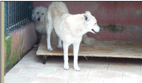
Razza : meticcio Sesso: femmina * Microchip n.° 380260010113287 Stato: Adottabile Ricoverata da giugno 2010