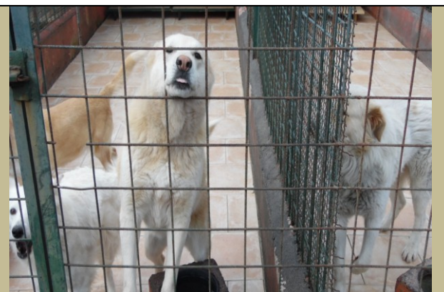
Razza: meticcio (grigio – beige) Sesso: femmina Microchip n.° 0977200004430666 ( sterilizzata ) Stato: Adottabile Ricoverata da settembre 2007