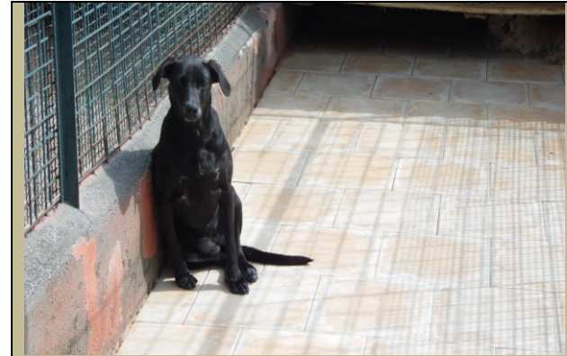
Razza : meticcio Sesso: femmina Microchip n.° 380260100183229 Stato: Adottabile Ricoverata dal 07 novembre 2014