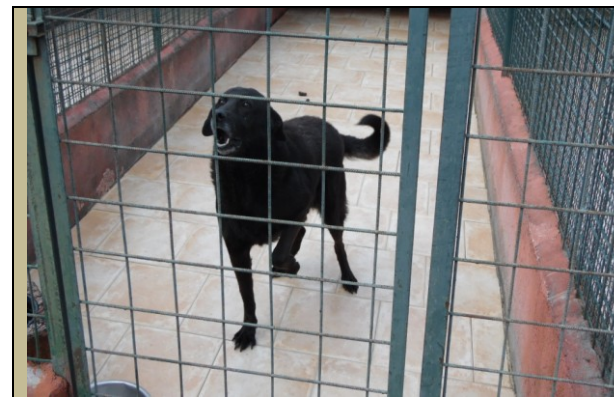
Razza: meticcio Sesso: maschio Microchip n.° 0977200004582846 Stato: Adottabile Ricoverato da novembre 2007