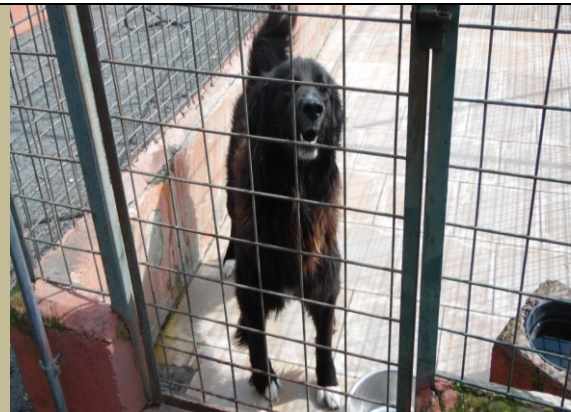
Razza: meticcio (Nero) Sesso: maschio Microchip n.° 380260040936929 Stato: Non adottabile (aggressivo) Ricoverato da marzo 2012