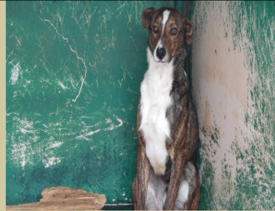
Razza: meticcio (Bianco/Tigrato) Sesso: maschio Microchip n.° 380260041236005 Stato: Adottabile Ricoverato da ottobre 2013 (nato feb./marzo 2013)