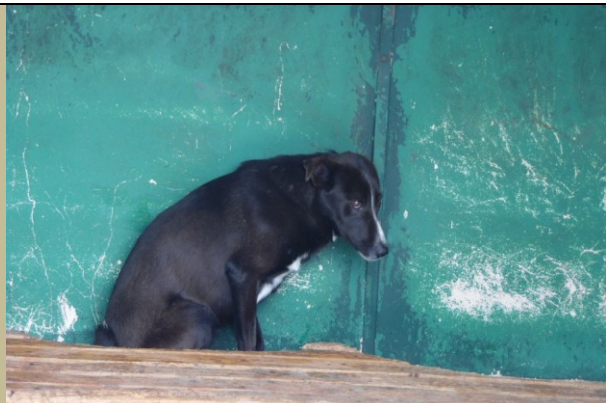
Razza : meticcio (Bianco/Nero) Sesso: maschio Microchip n. 380260041233056 Stato: Adottabile Ricoverato da ottobre 2013 (nato feb./marzo 2013)