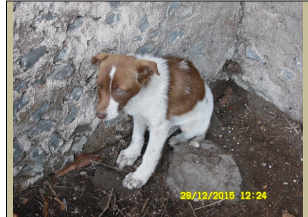
Razza: meticcio (cucciolo) Sesso: femmina Microchip n.° 380260042641179 Stato: adottabile (fulvo-bianco) Ricoverato dal 29 dicembre 2015